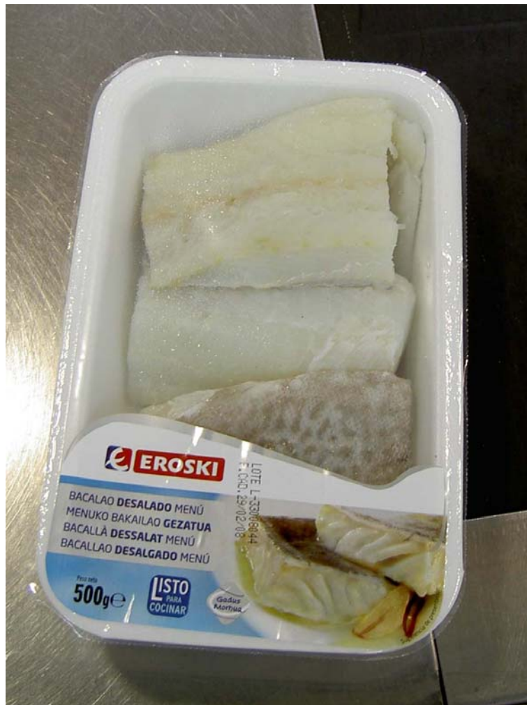
Bilde 3 Eksempel på utvannet saltfisk solgt i kjøledisk i supermarkedskjeden EROSKI. LISTO PARA COCINAR viser at produktet er gryteklart. Desalado (på 4 språk/dialekter) viser at det er utvannet, dvs at det opprinnelig har vært en saltfisk