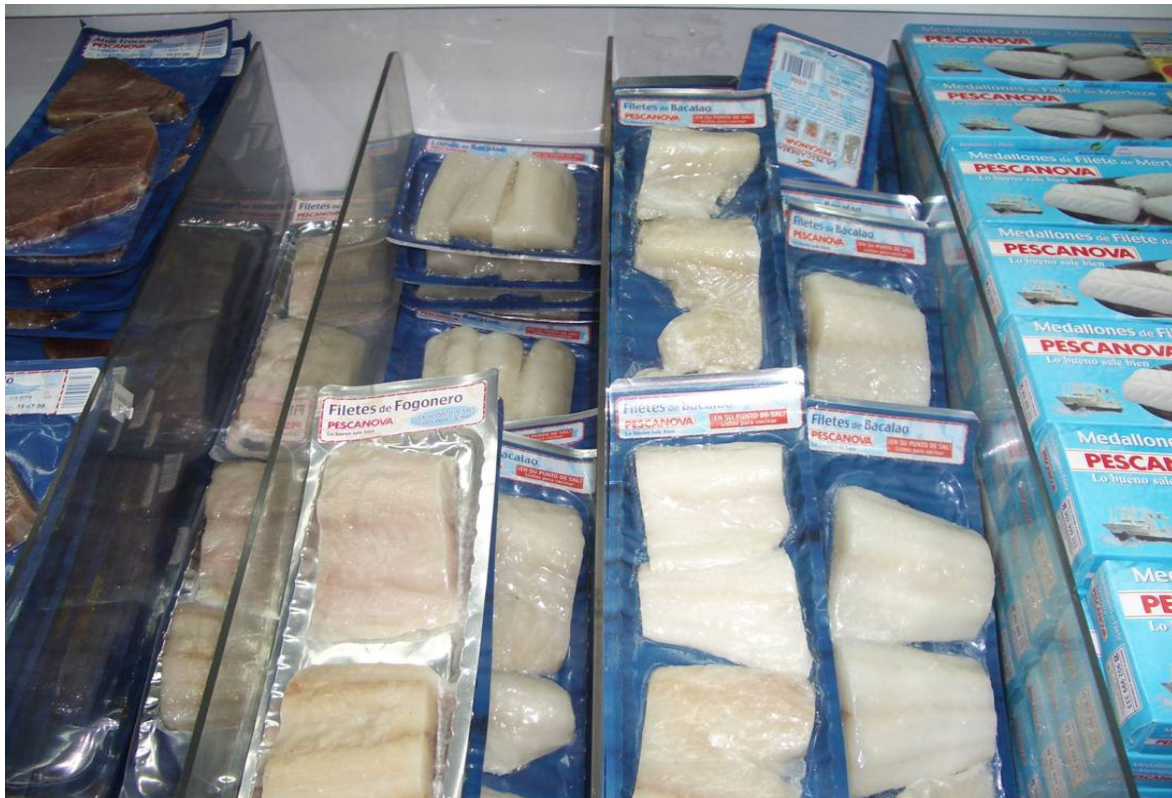
Bilde 1 Fra frysedisk i spansk supermarked. Lettsaltet sei, "Filetes de Fogonero" og lettsaltet torsk "Filetes de Bacalao" ligger side om side. Som man ser er fargen på seien veldig lys