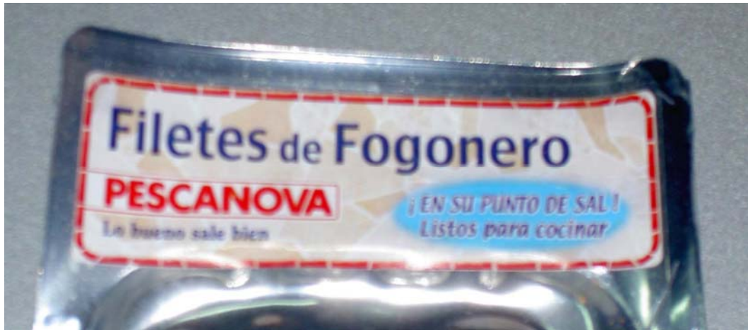
Bilde 2 Emballasjen til den lettsaltede seien. "EN SU PUNTO DE SAL" betyr "passe salt" og "LISTOS PARA COCINAR" betyr gryteklar